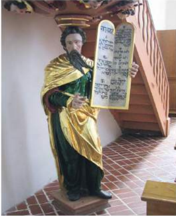
Michaeliskirche, Bautzen

Jesus ist nicht gekommen, um das Gesetz und die Propheten des Alten Testaments aufzuheben. Das, was für das Volk Israel Fundament war, bleibt für den Juden Jesus gültig. Jesus ist gekommen, um alles, was in der Heiligen Schrift des Alten Bundes steht, umzusetzen. Jesus will Gottes Gebot „erfüllen“, was so viel heißt wie „anfüllen mit Geist und Leben“. Erfüllen bedeutet dann mehr, als nur die Gesetze und Gebote pflichtgemäß einzuhalten.